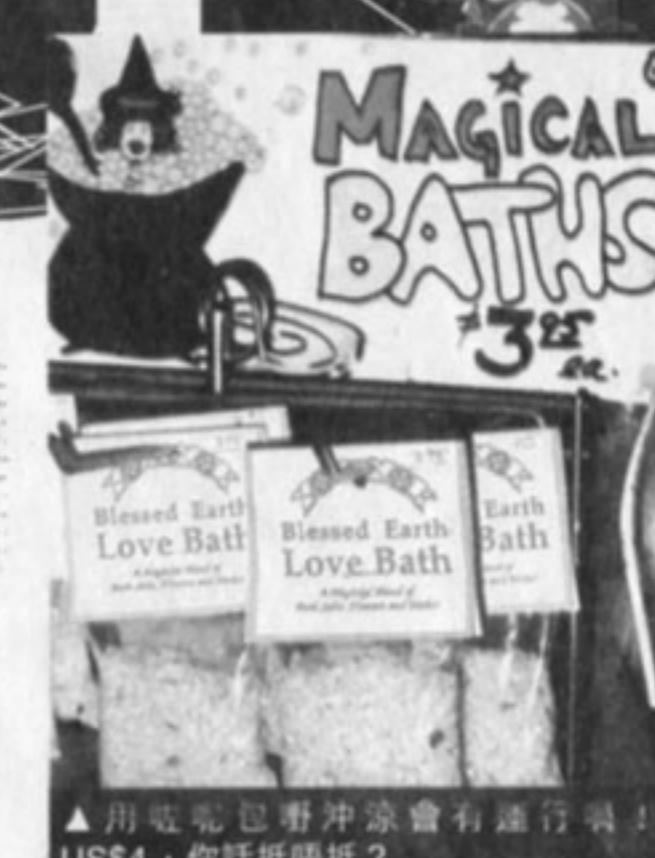
▲用呢呢包着沖涼會有迷行嘍！US$4，你話抵唔抵？