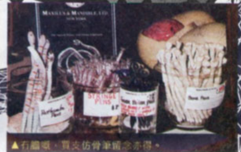
▲石蠟嘍，買支仿骨筆留念亦得。

紐約七人都有，一個曼克頓區 (Manhattan) 就有哈林黑人，又有世界級大富豪。不過最怪係嗰個世界文明先進嘅地方，竟然有人信巫師，亦有人學巫術，於是有關店舖十分受歡迎，筆者嗰第九街發現有一間巫術店，採訪之時，短短45分鐘就已經有十多人到來幫襯，而且唔少人仲好鬼認真咁去尋求意見，要求幫忙。入面職員每位都係受過專業訓練嘅巫師，而呢度除咗有不同嘅巫術用品發售之外，亦有巫師替你做法事，十分神奇。