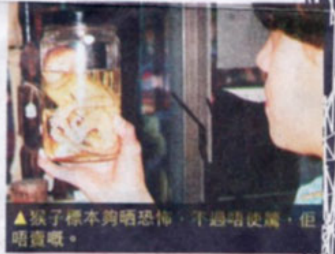
▲猴子標本夠唔恐怖，不過唔使買，但唔買嘢。