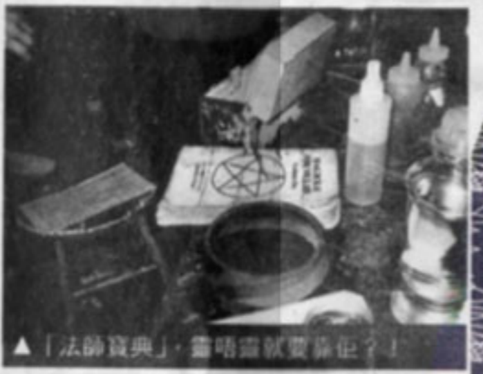
▲「法師寶典」，畫唔畫就要靠佢！