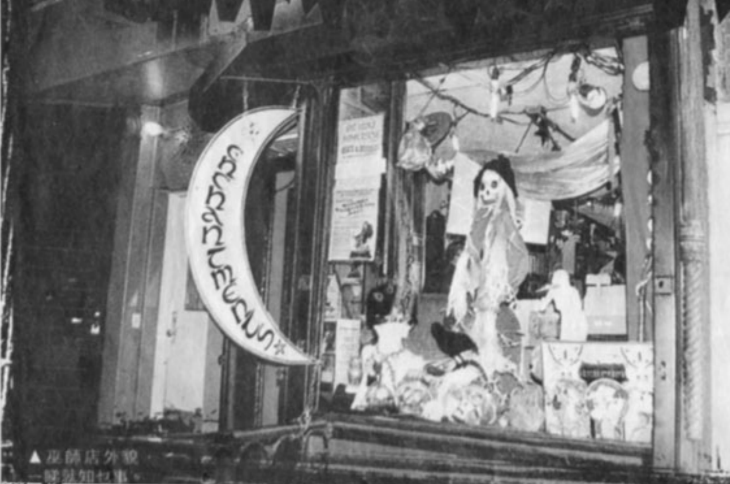
▲巫師店外觀，一睇就知乜嘢。